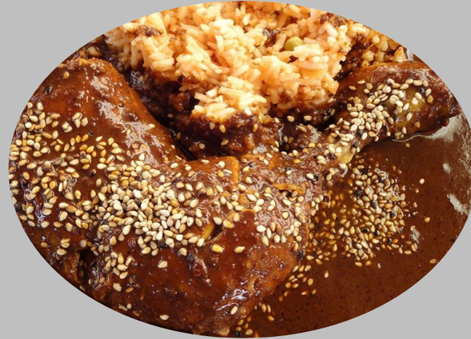
Plato de fondo: Pollo con mole