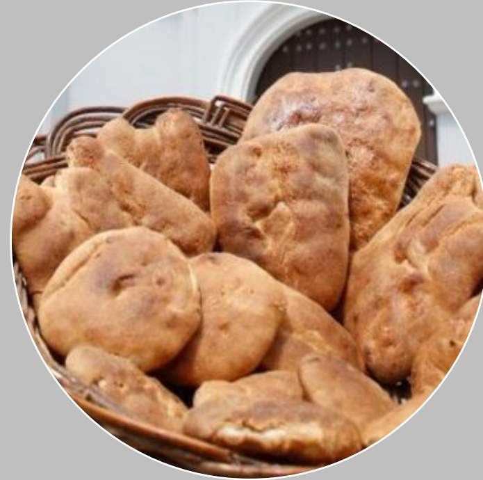
Pan de anís