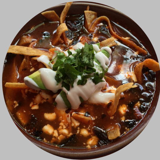
Entrada: Sopa de tortilla